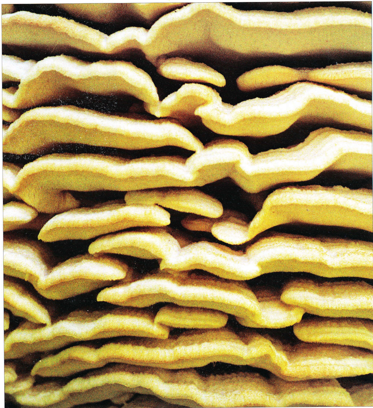
Põhjanarmiku viljakeha.

Häid fotosid on sellest seenest tehtud vaid erandharva: harilikult kasvab ta puutüvel mitme meetri kõrgusel, seepiltnikul pole aga kaasas redelit. Siinsed pildid on teinud Reimo Rõivis 5. septembril 2000 Viru-Nigula pastoraadi õuel, kus seen kasvas vanal vahtral.